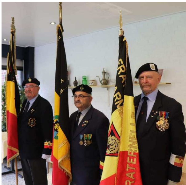
Les Porte-Drapeaux, présents !